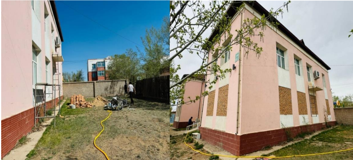
Зураг 5. Архивын цонх битүүлэх явц Зураг 6. Архивын цонх битүүлсний дараа

• Архивын хадгаламжийн нэгж, нягтаршуулсан шүүгээний талаарх одоогийн байдлаарх мэдээлэл судалгааг мөн цаашид авах шаардлагатай арга хэмжээ, нэмж шаардагдах нягтаршуулсан шүүгээний судалгааг тооцоолон гаргаж нэгдсэн архивын газарт санал хүргүүлсэн.