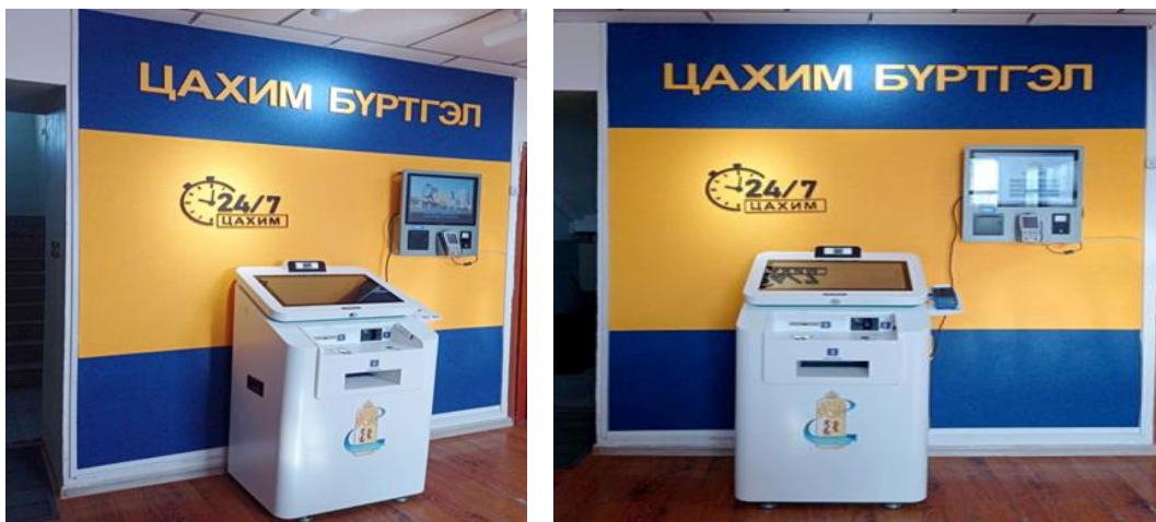
Зураг 7. 24/7 үйлчилгээний хэсэг

Сүхбаатар аймгийн Улсын бүртгэлийн хэлтсийн байранд 24/7 цахим үйлчилгээний төвийг 2024.02.06 өдөр нээж иргэдэд цагийн хязгаарлалтгүйгээр улсын бүртгэлийн үйлчилгээг үзүүлэх боломжтой болгосон.