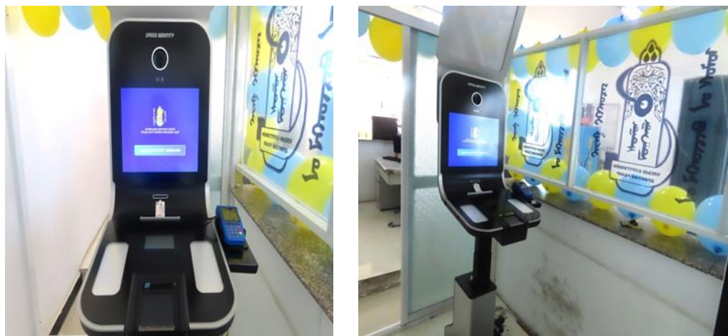
Зураг 8 Бичигт боомтод байршуулсан цахим машин

Улсын бүртгэлийн үйлчилгээг иргэдэд ойртуулах, цахим үйлчилгээг нэмэгдүүлэх зорилтын хүрээнд гадаад паспорт захиалах 24/7 цахим машиныг Сүхбаатар аймгийн Эрдэнэцагаан сум Бичигт боомтын байранд 2024.04.30 өдөр байршуулан үйлчилгээ үзүүлж байна.