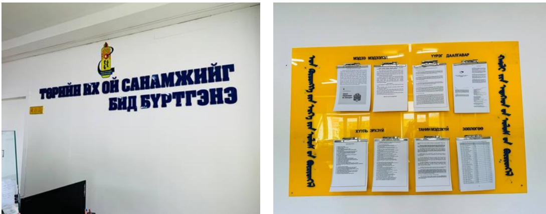
Зураг 3. Үйлчилгээний танхим тохижуулсны дараа

Тайлангийн хугацаанд эд хөрөнгийн эрхийн улсын бүртгэлийн чиглэлээр үзүүлсэн үйлчилгээний тоон мэдээг нэгтгэвэл: