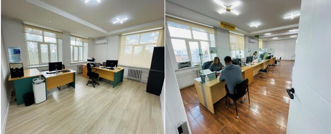
Зураг 2. Засвар хийсний дараахь байдал