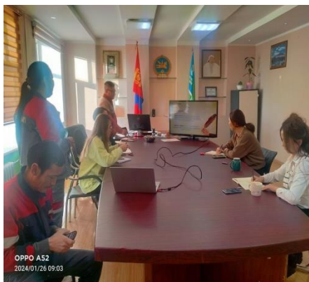
Зураг 1. Сургалтын явц