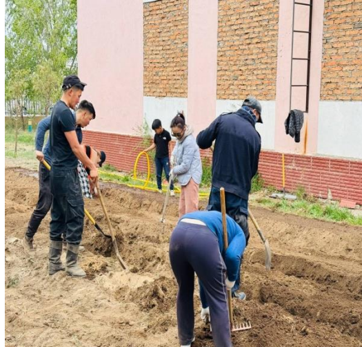
Зураг. Ногоо тарих явцаас